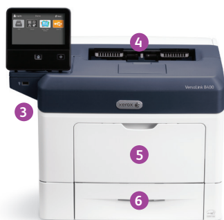
Xerox® VersaLink® B400 printer Print.

2 USB-poorten kunnen worden uitgeschakeld; 3 alleen voor VersaLink B405.