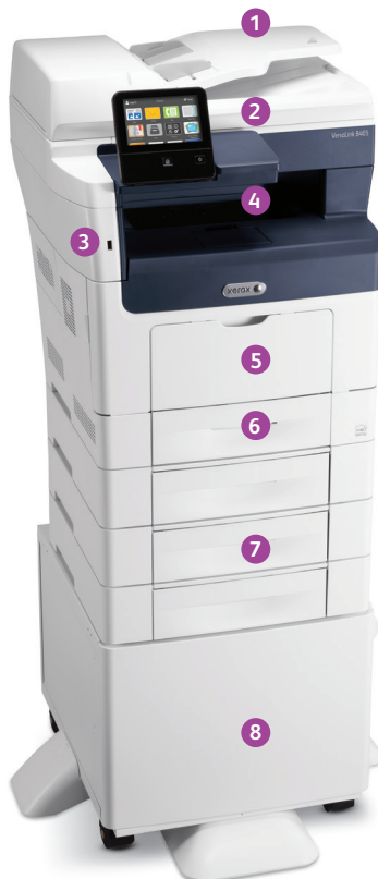
Xerox® VersaLink® B405 multifunctionele printer Print. Kopieer. Scan. Fax. E-mail.