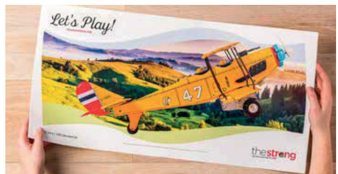
Afdrukken op extra lange vellen – maximum papierformaat 330 x 660 mm

Alles bij elkaar leidt dit tot betere marges, hogere winsten en het vermogen om strategisch te groeien met een enkele investering die berekend is op de toekomst.