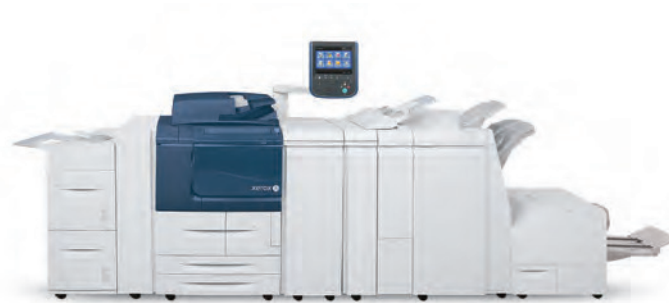
Xerox® D136 copier/printer met optionele inlegmodule met 2 inlegstations, standaardafwerking, vouweenheid en post-process invoegenheid.

Met innovatieve productieoplossingen wordt het milieu ontzien.