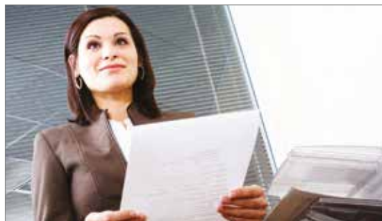
Stuur printopdrachten van desktop printers door naar multifunctionele apparaten voor lagere printkosten.